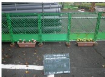
安全柵にフラワーポット設置