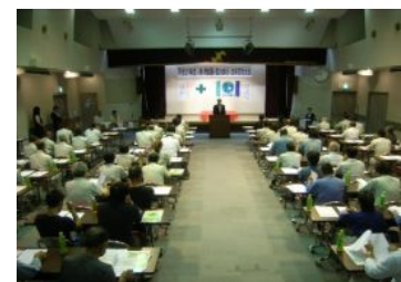
エコアクション21の紹介