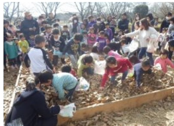
落ち葉プールで宝探し